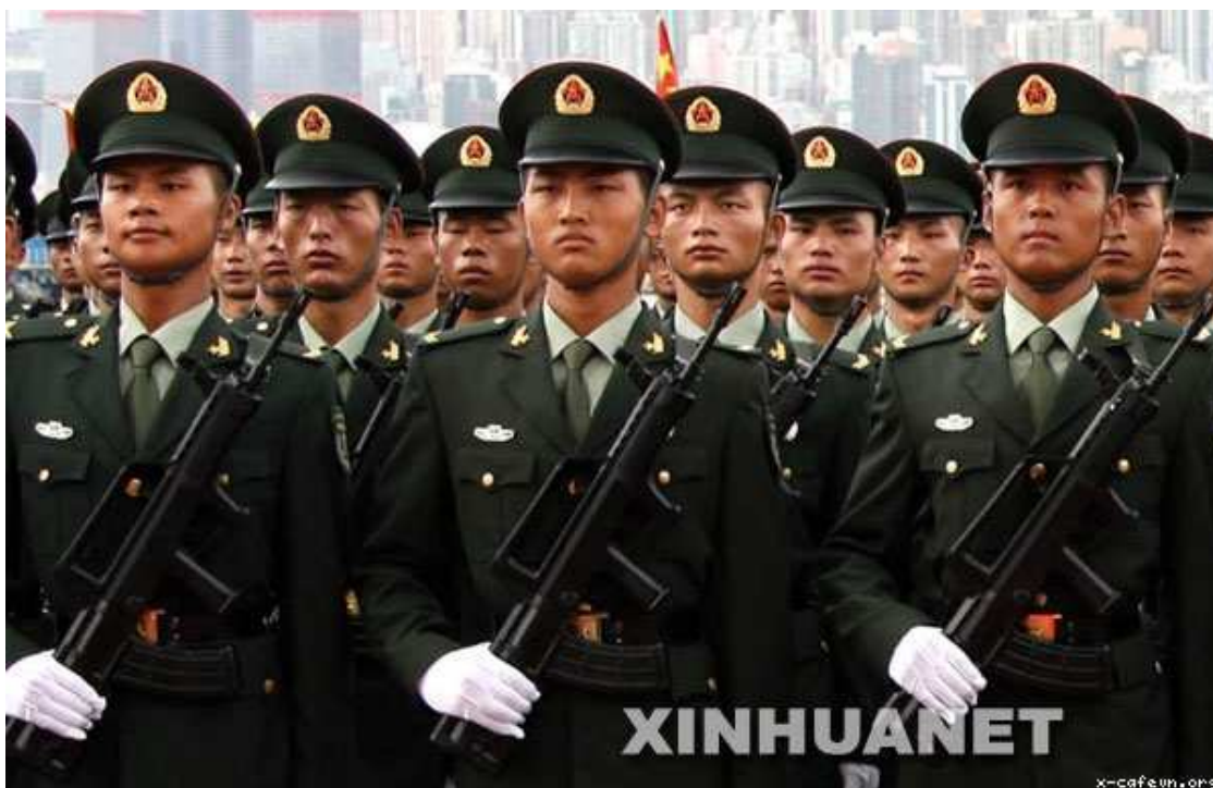
Chú thích ảnh: 这是陆军男士兵春秋常服 (Giá thị lực quân nam sĩ binh xuân thu thường phục)

Mẫu pano được kẻ, vẽ và dựng tại TP.HCM. Hồi đầu tháng này, một số pano đã được dựng tại một số khu vực ở TP.HCM, nhân dịp kỷ niệm 65 năm ngày thành lập Quân đội nhân dân Việt Nam (22/12/1944 – 22/12/2009) và những pano ấy đã tạo ra một vụ tai tiếng.