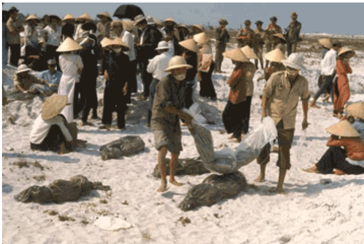
Vài hôm sau tiểu đoàn 39 Biệt

“Biết cha mình già cả lại vô tội, bị đem đi giết thật đau đớn khôn cùng, nên suốt bao năm sau đó tôi cứ tự hỏi trong tức tưởi ông ngoại mấy cháu có tội tình chi mà chết đau đớn như ri!”